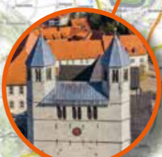
Stiftskirche in Bad Gandersheim