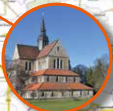
Klosterkirche St. Mariae Riddagshausen