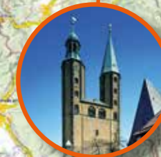
Marktkirche St. Cosmas und Damian in Goslar