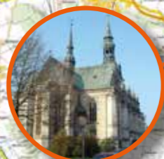
Hauptkirche Beatae Mariae Virginis Wolfenbüttel