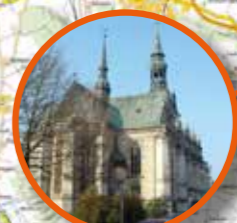
Hauptkirche Beatae Mariae Virginis Wolfenbüttel