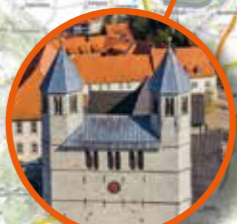
Stiftskirche in Bad Gandersheim