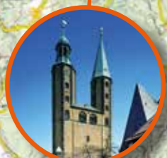
Marktkirche St. Cosmas und Damian in Goslar