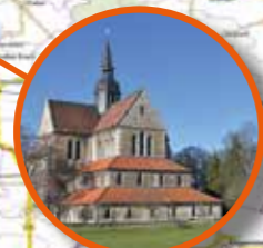
Klosterkirche St. Mariae Riddagshausen